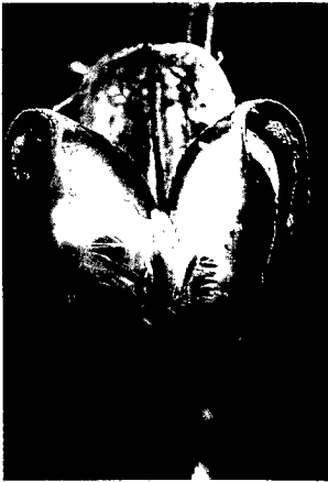
図2 ウバユリの果実と種子